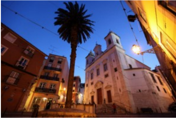
Alfama wijk Lissabon

Wat een geluk als je in Lissabon woont, met z'n ligging op zeven heuvels langs de machtige rivier de Taag en uitzicht op de Atlantische Oceaan. Het geeft Lissabon licht, lucht en leven. Maak een rit met de kanariegele tram 28 en zie de authentieke Portugese hoofdstad aan je voorbijtrekken om te belanden in het hart van volkswijk Alfama. Bezoek ook zeker het historische Castelo de São Jorge, het hoogstgelegen gebouw in Lissabon van waaraf je een fantastisch uitzicht op de stad en omgeving krijgt.