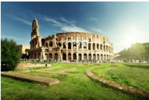
Rome is in feite een groot openluchtmuseum. Hier het Colosseum.