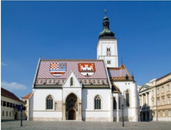
Sveti Marka kerk, symbool van Zagreb.

De 900 jaar oude hoofdstad van Kroatië bruist, bloeit en is hip. Het relaxte Zagreb is het culture en politieke hart van Kroatië dat je grofweg kunt onderverdelen in: de oude stad Gornji Grad, ook wel Bovenstad genoemd en Donji Grad, de Benedenstad. Beiden delen zijn verbonden met een funicular, een felblauw trammetje dat de hele dag heen en weer zoeft.